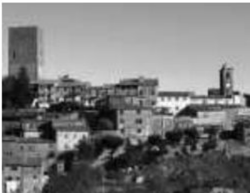
Una veduta di Montecatini

MONTECATINI VdC. Cerimonia di riapertura al culto della chiesa parrocchiale di San Biagio dopo il lungo restauro. Lunedì 8 dicembre, alle ore 16, in occasione della festa dell'Immacolata Concezione, monsignor Alberto Silvani, vescovo di Volterra, presiederà la celebrazione della messa con il rito di benedizione della Chiesa, e amministrerà la Cresima a 10 ragazzi della parrocchia. Precedentemente la cerimonia, saranno ricevute le autorità. Alle ore 17,30 vi sarà una visita alla rinnovata Casa Canonica, a cui farà seguito un incontro conviviale. La chiesa di San Biagio fu costruita nella metà del XIV secolo, mentre la canonica annessa, che privò con la sua costruzione, la facciata originaria della chiesa, risale al XVI secolo.